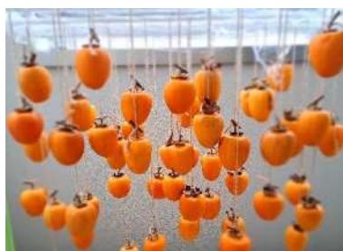
実際の干し柿制作の様子