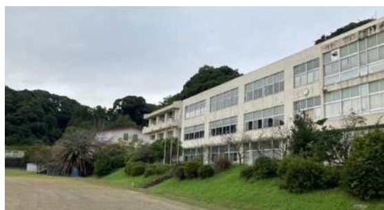
図1 旧豊岡東小学校(2015年廃校)

敷地地区は、静岡県の「ふじのくに美しく品格ある邑づくり」に参加するコミュニティである。地域住民の高齢化により廃校周辺の里地里山の保全が課題となっている現状を踏まえ、廃校利活用と合わせて、森林の活用のあり方を探ることを研究の目的とした。