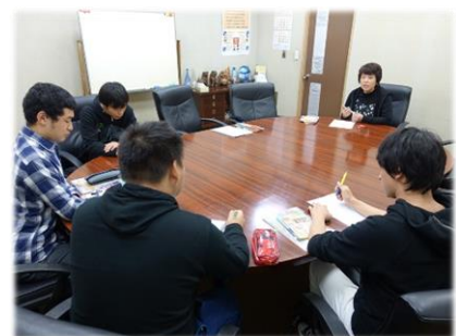
図1 御殿場市商工会での聞き取り

そこで、まずは御殿場駅周辺の商店街における空き店舗の実態を把握するとともに、店主および地元の高校生を対象としたアンケート調査を行い、その集計結果から御殿場ならではの提案することが、本研究の目的である。