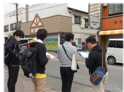
図2 フィールドワークの様子