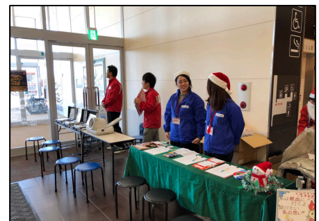
写真 3 ショッピングモールにおける献血活動と学生ボランティア

④12月9日、イオンモール市野店での献血活動と学生ボランティアの様子に加え、学生達がどのような気持ちでボランティアを行っているか、インタビューによる調査をおこなった。その結果、ボランティアに取り組む学生たちは、若年層への献血を促す重要性を明確に認識しており、各自が自主的に考え、活動していることがわかった。セミナー等や献血の重要性を理解した私たちも、大変共感を持っている意見を多く聞くことができた。活動に従事する学生たちは「若者に献血への関心、興味をもってもらうため、若年層の方々に実際に学生ボランティアの方が訴えることが重要だ。それまで関心のなかった方でも自分と近い年の人がこうした活動に取り組んでいることを知ってもらい、それがきっかけとなり、献血への興味や関心に繋がる。」とのことだった。また「献血を行うことで救える命があり、それがやりがいになっている」と話し、「そのことを若年層の方に知ってもらいたい」と言っていた。これらの意見から、私たちも献血の重要性をしっかりと同年代に伝え、知ってもらう行動を起こす必要があると考え、そのためにはどのようなやり方が効果的か、ヒントを得た。