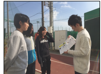
写真4,5 学内での献血推進活動

今回の研究を通じて得られた成果を主に以下の2点に集約した。まず、大学生や若者が集まるイベント等を通じて、献血の大切さや献血場所を自分たちで伝えることである。例えば、磐田ではサッカー、ラグビー、サーフィンなど若者が集まるスポーツイベントがある。若者だけでなくイベントに来ている子どもたち、その親たちにも献血の大切さを伝える良い機会だと考える。次に、アンケートの結果から、大学生はキャンパスに献血車が来たときに、友人・先輩・後輩からの口コミで、何かプレゼントがある(本学ではライオンズクラブより食券)と献血行動を起こしやすいことがわかった。そのため学内での献血活動では、学生自身によるチラシ配布だけでなく、LINEやTwitterでこれらの情報を多くの学生に伝えることが効果的だと考える。こうした行動を静岡県内の各大学にも連携を促すことで、静岡県内の若者の献血参加率の上昇が可能だと考える。