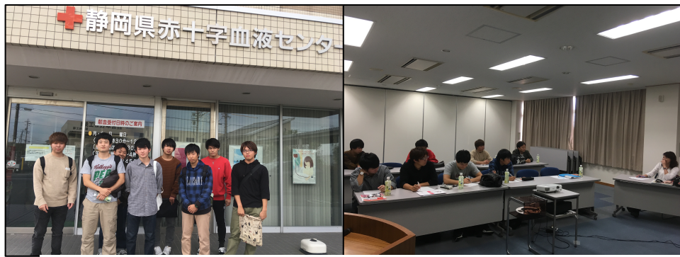
写真 1,2 静岡県赤十字血液センター浜松事業所にて献血セミナー受講と質問、意見交換

④12月9日、イオンモール市野店での献血活動と学生ボランティアの様子に加え、学生達がどのような気持ちでボランティアを行っているか、インタビューによる調査をおこなった。その結果、ボランティアに取り組む学生たちは、若年層への献血を促す重要性を明確に認識しており、各自が自主的に考え、活動していることがわかった。セミナー等や献血の重要性を理解した私たちも、大変共感を持っている意見を多く聞くことができた。活動に従事する学生たちは「若者に献血への関心、興味をもってもらうため、若年層の方々に実際に学生ボランティアの方が訴えることが重要だ。それまで関心のなかった方でも自分と近い年の人がこうした活動に取り組んでいることを知ってもらい、それがきっかけとなり、献血への興味や関心に繋がる。」とのことだった。また「献血を行うことで救える命があり、それがやりがいになっている」と話し、「そのことを若年層の方に知ってもらいたい」と言っていた。これらの意見から、私たちも献血の重要性をしっかりと同年代に伝え、知ってもらう行動を起こす必要があると考え、そのためにはどのようなやり方が効果的か、ヒントを得た。