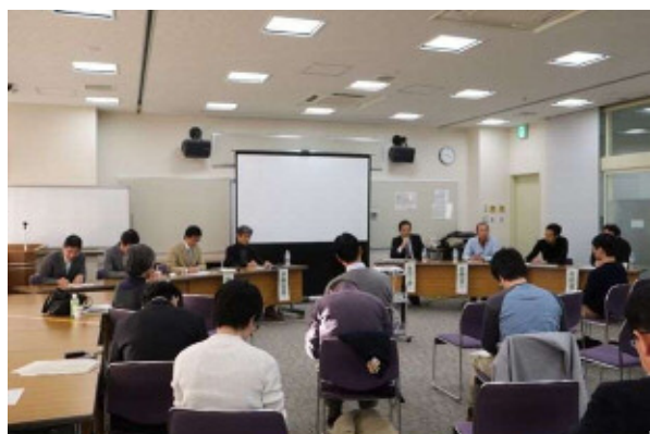
ディスカッション風景