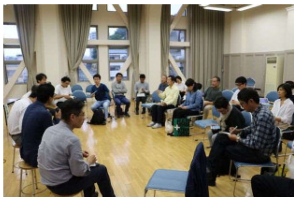
ディスカッション風景