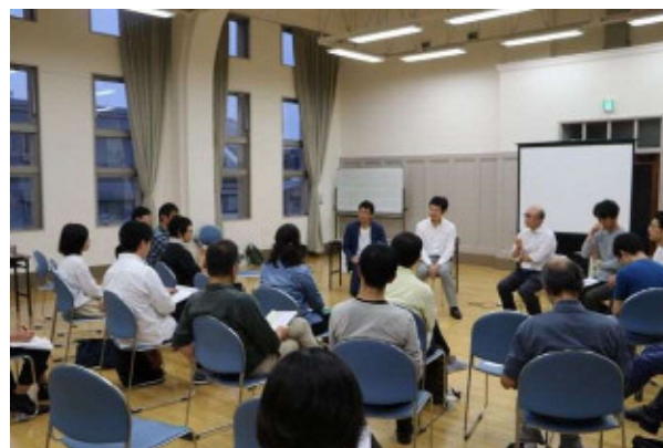
ディスカッション風景