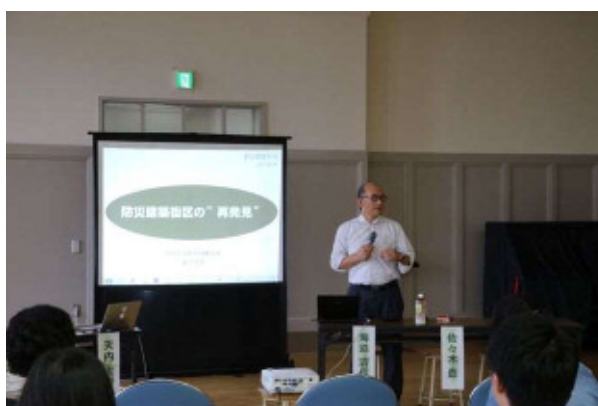
講演する海道教授